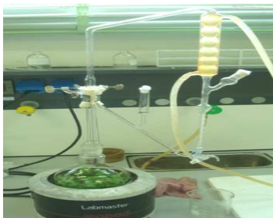
Fig.2: Montage d'hydrodistillation (Clevenger).