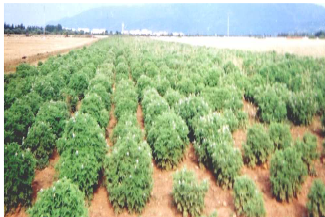
Fig.1: Champ de culture de géranium rosat à Chiffa.

(Alger) en comparaison avec un spécimen déposé dans l'herbier.