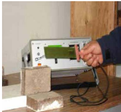
Fig. 4: Essai au CT-mètre du CNERIB

La méthode du fil chaud permet d'estimer la conductivité thermique d'un matériau à partir de l'évolution de la température mesurée par un thermocouple placé à proximité d'un fil résistif.