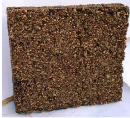
Fig. 3: Epreuve cellulose/grignon